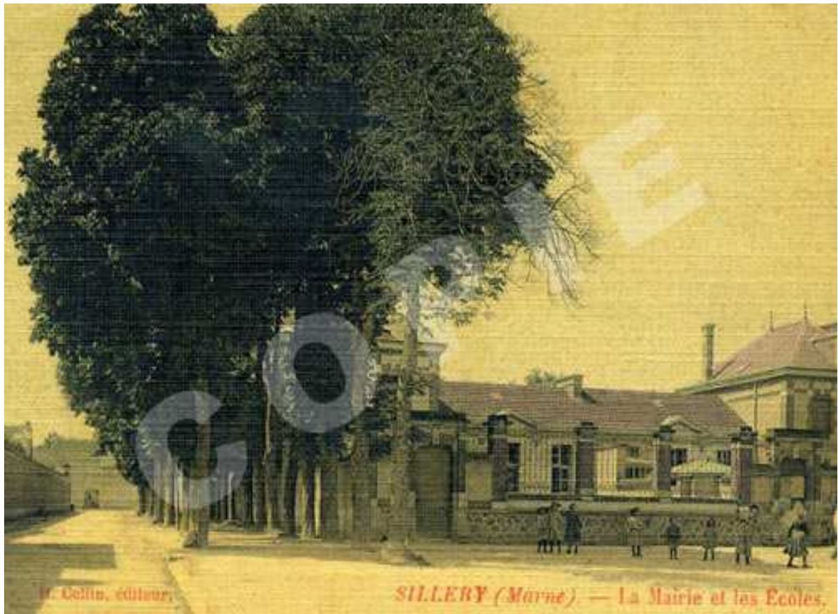
Carte postale vers 1900. Groupe scolaire et mairie inaugurés le 26 décembre 1887. La rue, à gauche sur la photo, est l'actuelle rue Nicolas Brulart. A l'extrémité de cette rue se trouvent aujourd'hui les feux de circulation. La double rangée d'arbres marque l'emplacement des anciens fossés.