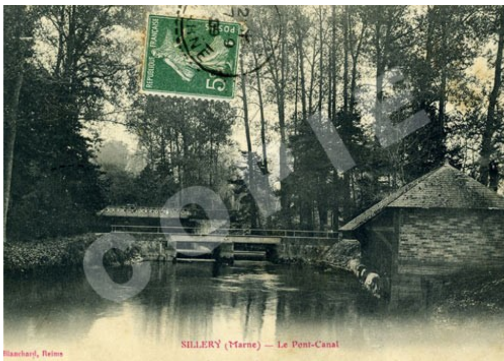
Vue du lavoir construit en 1857