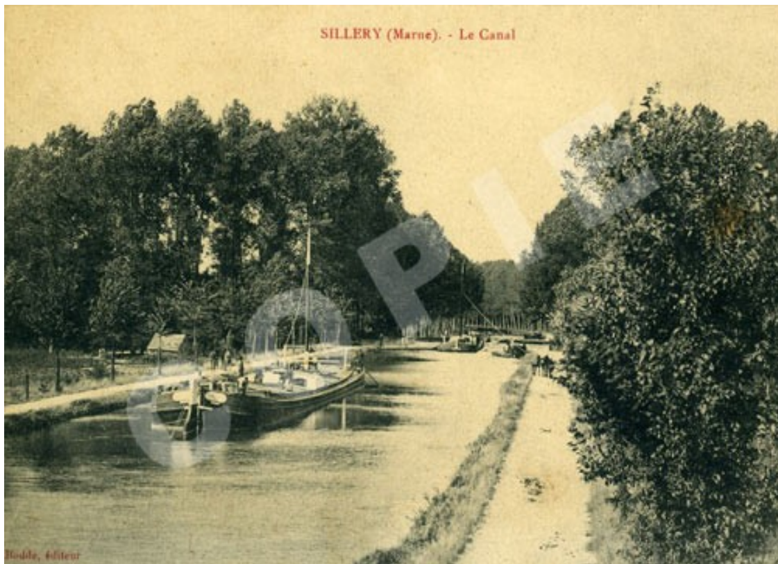
Le canal près de l'écluse vers 1900. On voit à gauche sur la carte postale le lavoir construit en 1894. Les péniches sont tirées par des chevaux depuis le chemin de halage.

Le lavoir fut donc reconstruit pour un coût de 3026,25 F sur la rive gauche de la Vesle entre le Pont-Canal et le Pont-Barrage, en l'agrandissant toutefois d'une travée supplémentaire et en réemployant les vieux matériaux. Procès-Verbal d'adjudication le 31/08/1893 et réception des travaux le 04/12/1894.