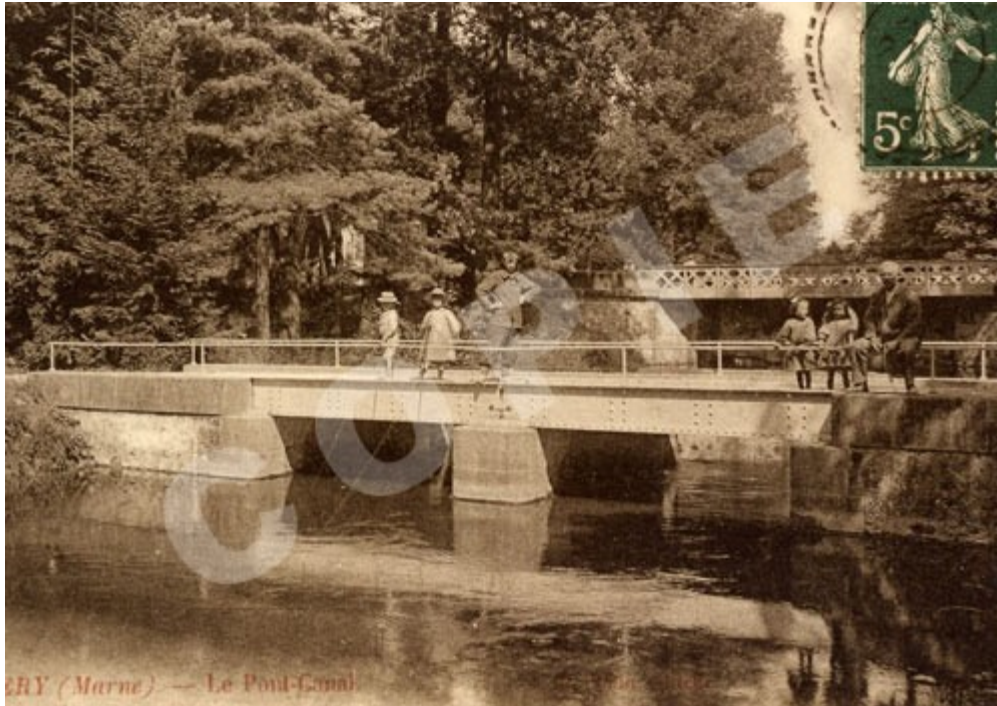
Le Pont-Barrage et le Pont-Canal sur la Vesle à Sillery, vers 1900. Le lit de la dérivation sera recréusé en aval du pont-barrage (certainement suite aux inondations de 1910). La conséquence de ces travaux sera l'installation de vannes pour maintenir le niveau de l'eau en amont.

Extrait de « Sillery et ses seigneurs », de M. l'abbé Péchenart édité en 1893 : « Un pont situé en dessous l'écluse de Sillery et jeté sur la Vesle pour relier le village aux marais qui s'étendent jusqu'à la ferme de Couraux, a été refait à neuf en 1893, aux frais de l'administration des ponts et chaussées. Les magnifiques travaux qui y ont été exécutés, s'élèvent en dépenses au total de 30,000 fr. environ. On se fera davantage une idée de la valeur de ces travaux, quand on saura qu'il a fallu creuser jusqu'à 7 mètres de profondeur pour assurer le pont sur une base solide. Les piles, dont la belle maçonnerie repose sur le béton, ont elles-mêmes 3m75 de hauteur. Ce pont-barrage doit servir surtout à régler les eaux de la Vesle ; car aux termes de conventions déjà anciennes, un tiers des eaux de la rivière appartient à la ville de Reims, un tiers aux ponts et chaussées et l'autre tiers aux riverains. Le lavoir vient d'être remis aussi en bon état pour le prix de 4000 fr. environ. (Septembre 1893). »