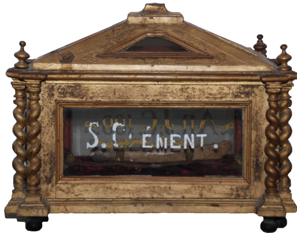
Reliquaire de Clément I er Église Saint-Remi de Sillery